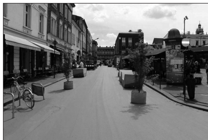
Fot. 1. Ulica Estery po wschodniej stronie Placu Nowego w trakcie prototypu

W pracy wykorzystano wyniki badań i wnioski z dwóch projektów, w których autor brał udział. Pierwszym był projekt „Alternatywna przestrzeń publiczna (APP) – Kazimierz 2017”, realizowany przez fundację Napraw Sobie Miasto, na zlecenie Urzędu Miasta Krakowa. Narzędziem badawczym użytym w tym projekcie było prototypowanie urbanistyczne, narzędzie tzw. urbanistyki zwinnej, szerzej zdefiniowanej w artykule P. Jaworskiego i A. Karłowskiej (2017). W ramach tej inicjatywy na dwóch pierzejach Placu Nowego ograniczono ruch samochodowy i stworzono z nich strefę pieszo-rowerową. Obszar tych badań wyróżniono za pomocą zielonej farby, a jezdnie wypełniono infrastrukturą tymczasową (meble miejskie i drzewa w doniczkach) – fot. 1.