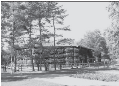
Fot. 2. Tężnia solankowa w Parku Zdrojowym Konstancina-Jeziorny

Centrum handlowe zostało otwarte w 2002 r. i znajduje się na terenie górnej papierni – szmaciarni. Budynki te zostały zaprojektowane w latach 30. lub 40. XIX w., a ich autorem był Jan Jakub Gay ( www.muzeumkonstancina.pl ). W 1984 r. wybuchł pożar, który w znacznym stopniu zniszczył wnętrza i konstrukcję budynków. Dopiero w 2000 r.