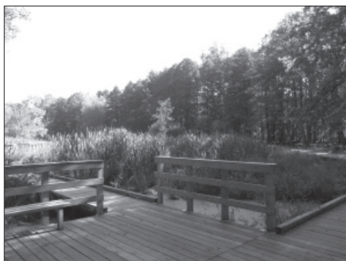
Fot. 3. Alejki spacerowe i taras widokowy w Parku Zdrojowym w Konstancinie-Jeziornie