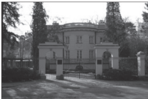
Fot. 1. Willa Pallas Athene w Konstancinie-Jeziornie

stanie technicznym 4 . Jedną grupą są budynki, które zostały wykupione przez prywatnych właścicieli i wyremontowane, gdyż dla niektórych osób posiadanie willi w Konstancinie to dowód bogactwa i symbol prestiżu. Przykładami takich obiektów mogą być: Willa Pallas Athene, Willa Kaprys czy Zagłobin. Willa Pallas Athene (fot. 1) znajdująca się przy ulicy Piasta powstała w 1906 r., zaś autorem projektu był Marian Lalewicz. Budynek jeszcze przed II wojną światową należał do kilku właścicieli. W latach 60. XX w. przeszedł remont, natomiast po 1979 r.