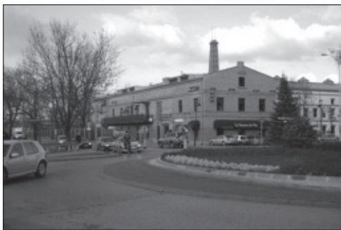
Fot. 4. Centrum Handlowe „Stara Papiernia” w Konstancinie-Jeziornie