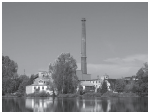
Fot. 5. Dawna fabryka papieru w Konstancinie-Jeziornie