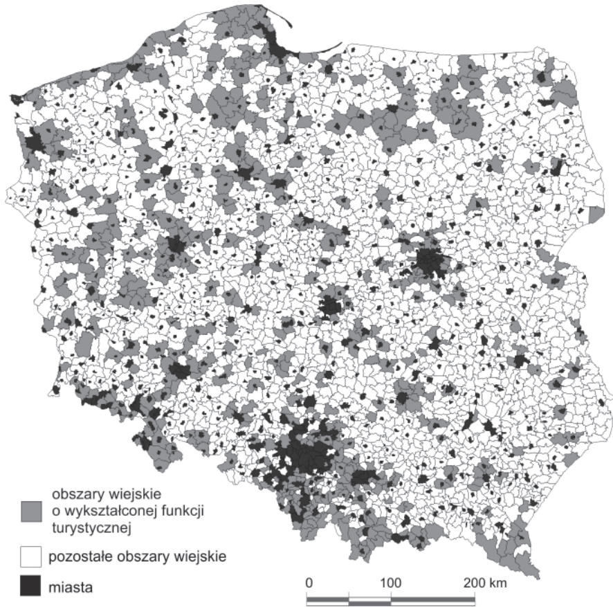
Ryc. 2. Obszary wiejskie o wykształconej funkcji turystycznej w 2005 r.