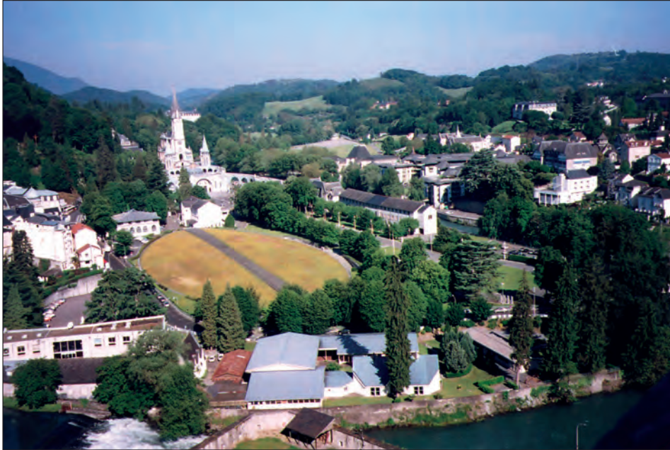
Fot. 4. Sanktuarium w Lourdes. Bazylika podziemna Piusa X