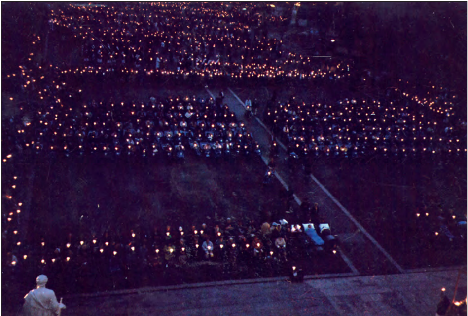
Fot. 7. Procesja różańcowa ze światłem