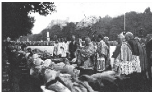
Fot. 3. Błogosławieństwo chorych (ok. 1920 r.)

procesja z Najświętszym Sakramentem miała miejsce 22 sierpnia 1888 r. Od początku połączona była z błogosławieństwem chorych, które dawniej odbywało się na placu przed Bazyliką Różańcową. Procesja wyrusza każdego popołudnia o godzinie 17.00, z okolic Groty do bazyliki Piusa X. Czoło procesji tworzą ludzie chorzy, w większości na wózkach, a nawet na łóżkach, na końcu niesiony jest Najświętszy Sakrament w otoczeniu duchownych i przedstawicieli chorych. W procesji uczestniczą członkowie licznych organizacji i stowarzyszeń religijnych,