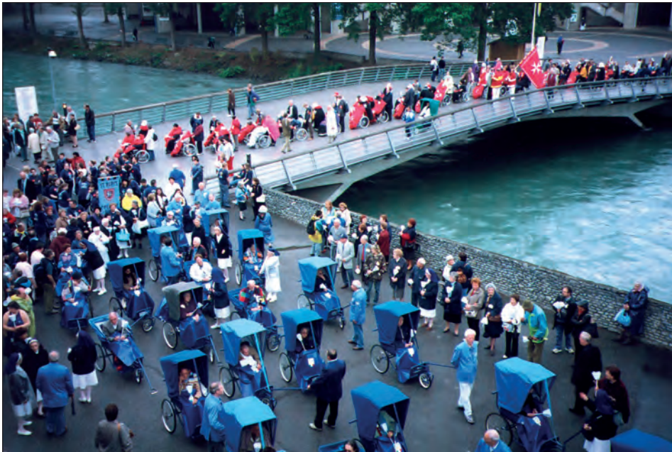
Fot. 5. Pielgrzymka chorych