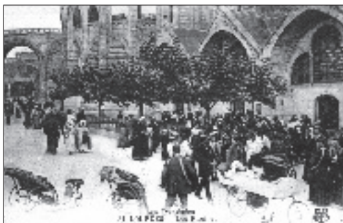
Fot. 2. Chorzy pielgrzymi w sanktuarium (1929 r.)