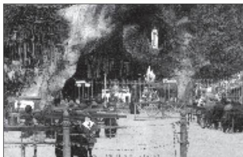
Fot. 1. Grota Masabielle – serce Lourdes (ok. 1910 r.)