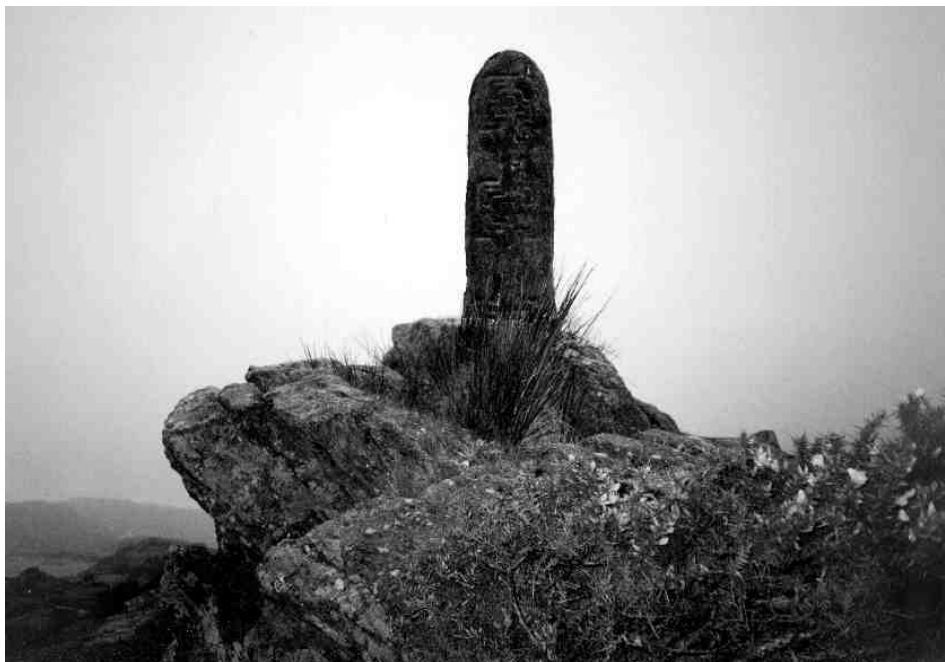
Druga stacja na trasie pielgrzymkowej do Glencolumbkille

żem w kole, na której staje pielgrzym, zwrócony twarzą ku zachodowi i wyraża swoje trzy życzenia;