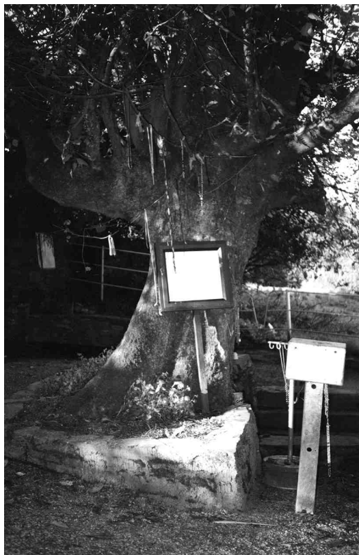
Drzewo z zawieszonymi na nim wotami przy studni w Ballyvourney

Ballyvourney, hr. Cork jest znane dzięki swojej patronce, opiekunce pszczoł, św. Gobnait, której święto, przypadające na 11 lutego, oraz niedziela Zielonych Świątek przyciągają w dalszym ciągu liczne rzesze pielgrzymów. Wszystkie stacje znajdują się w pobliżu średniowiecznego kościoła. Pierwszą stacją stanowi chata w kształcie ula pszczelego, zwana "Domem Gobnait", w której umieszczono rzeźbioną podobiznę świętej. Nad zewnętrznym oknem średniowiecznego kościoła widnieje prymitywna, naga postać kobieca, znana jako "sheela-na-gig", którą pielgrzymi dotykają rękami. Jedną ze stacji jest kopiec kamieni, zwieńczony "bullaun'em" (kamień mający jedno lub więcej wgłębień). Kopiec ten ma wyzna-