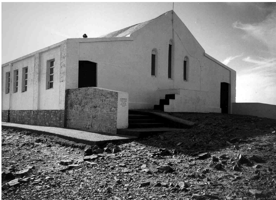
Kościół na szczycie góry w Croagh Patrick

poprzestaje na tym; schodzą oni do świętej studni w Kilgeever i wykonują dalsze okrążenia.