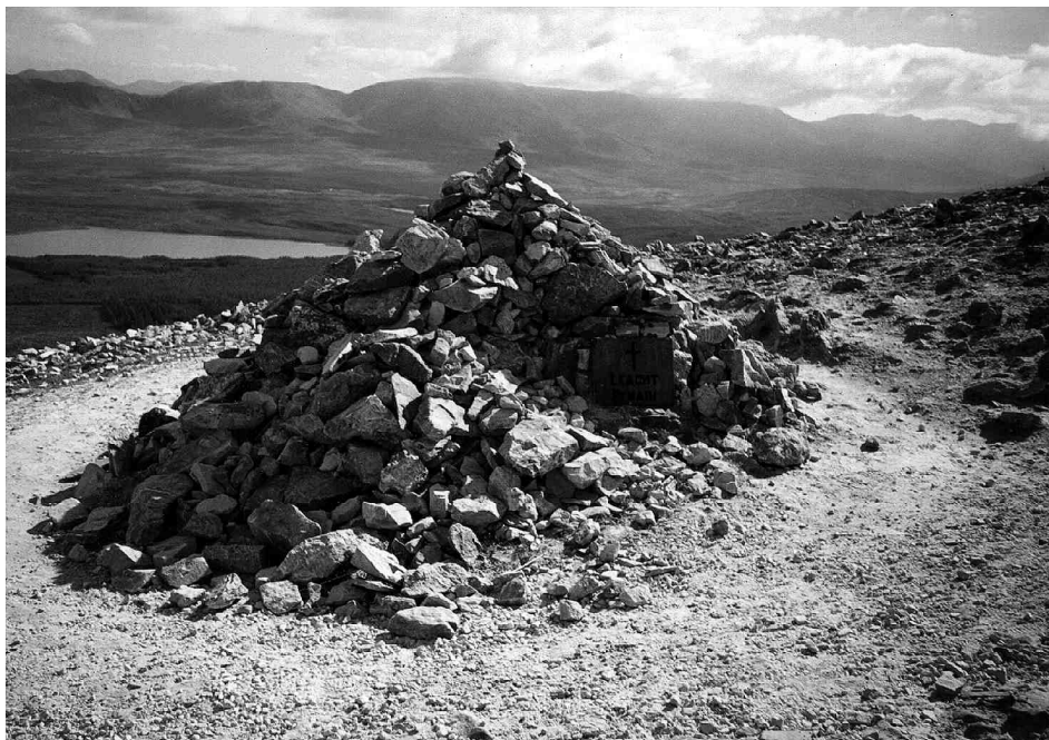
Pierwsza stacja w drodze do Croagh Patrick

również mogą prowadzić przez strumień. Praktyki, związane z obchodzeniem drzew, studni i kamieni, jak i z chodzeniem na kolanach, były najczęściej odnotowywane przez wrogo do nich nastawionych obserwatorów, którzy byli nimi przerażeni i widzieli w nich tylko prymitywne barbarzyństwo i przesady. Powyższe opinie wynikały z niezrozumienia intencji pielgrzyma, który nie czcił drzew, kamieni czy studni, lecz otaczał je szacunkiem ze względu na ich związek ze świętą osobą. Kamienie mogły być tutaj umieszczone przez świętego, a studnia była często powołana do istnienia dzięki jego ponadnaturalnej sile 3 . Opisanie każdej pielgrzymki nie jest możliwe, a dodatkowe ograniczenia objętości artykułu pozwalają na zaprezentowanie tylko pewnych przykładów, które zawierają jednak dużo motywów powtarzających się w każdej pielgrzymce.